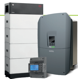
PLENTICORE in der dritten Generation