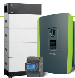
PLENTICORE plus der ersten und zweiten Generation

Doppelt gespart und zweifach profitiert: Nutzen Sie daher zusätzlich auch den attraktiven Preisvorteil des KOSTAL Energy Meters.