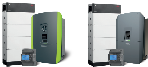
PLENTICORE plus de la première et deuxième génération

Doublez les économies et doublez les avantages : Vous pouvez ainsi profiter de l'avantage de prix du KOSTAL Energy Meter.